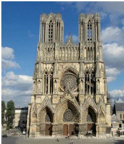
Au cœur de la ville (Notre Dame de Paris)