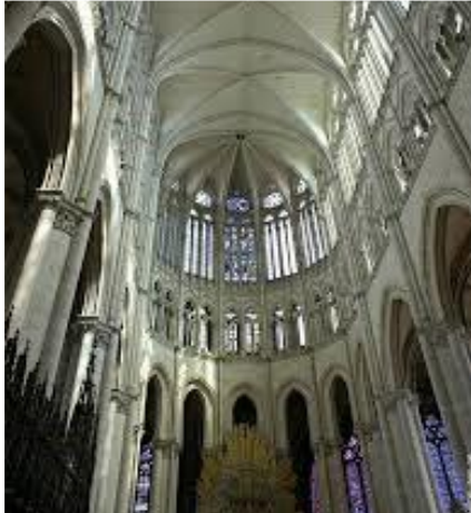
Élancée vers le ciel (Amiens)