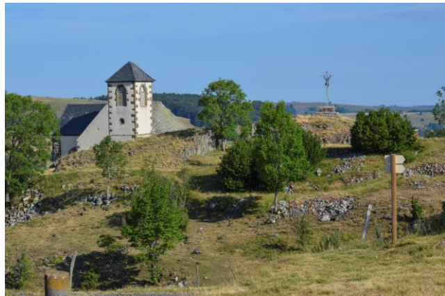
Ou isolée et difficile d'accès (Notre Dame de Valentine, 15)