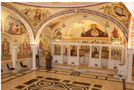
Saturée d'images (église orthodoxe roumaine, La Courneuve 93)