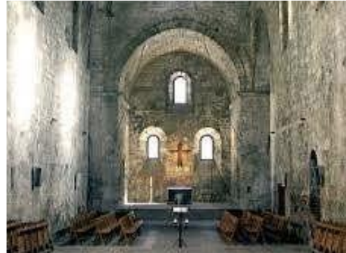
Ou presque enterrée (Boscodon, 05)