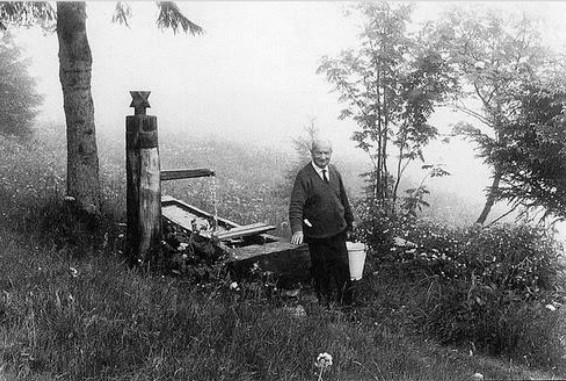
Martin Heidegger, 1889-1976.