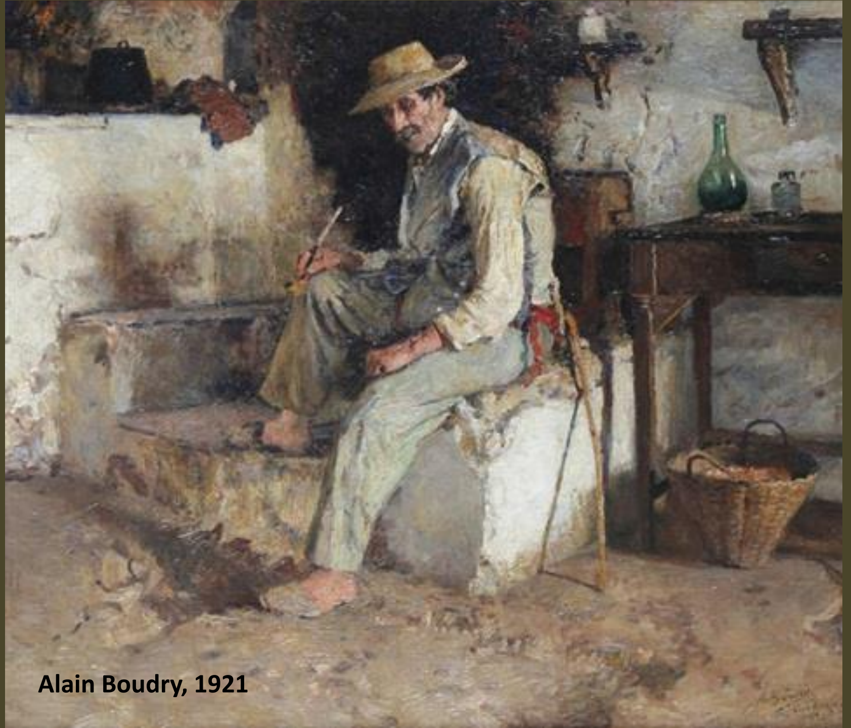
Alain Boudry, 1921