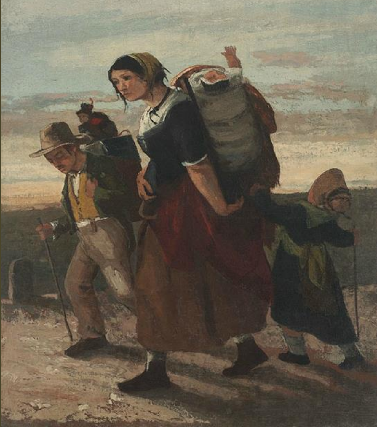
Gustave Courbet 1854