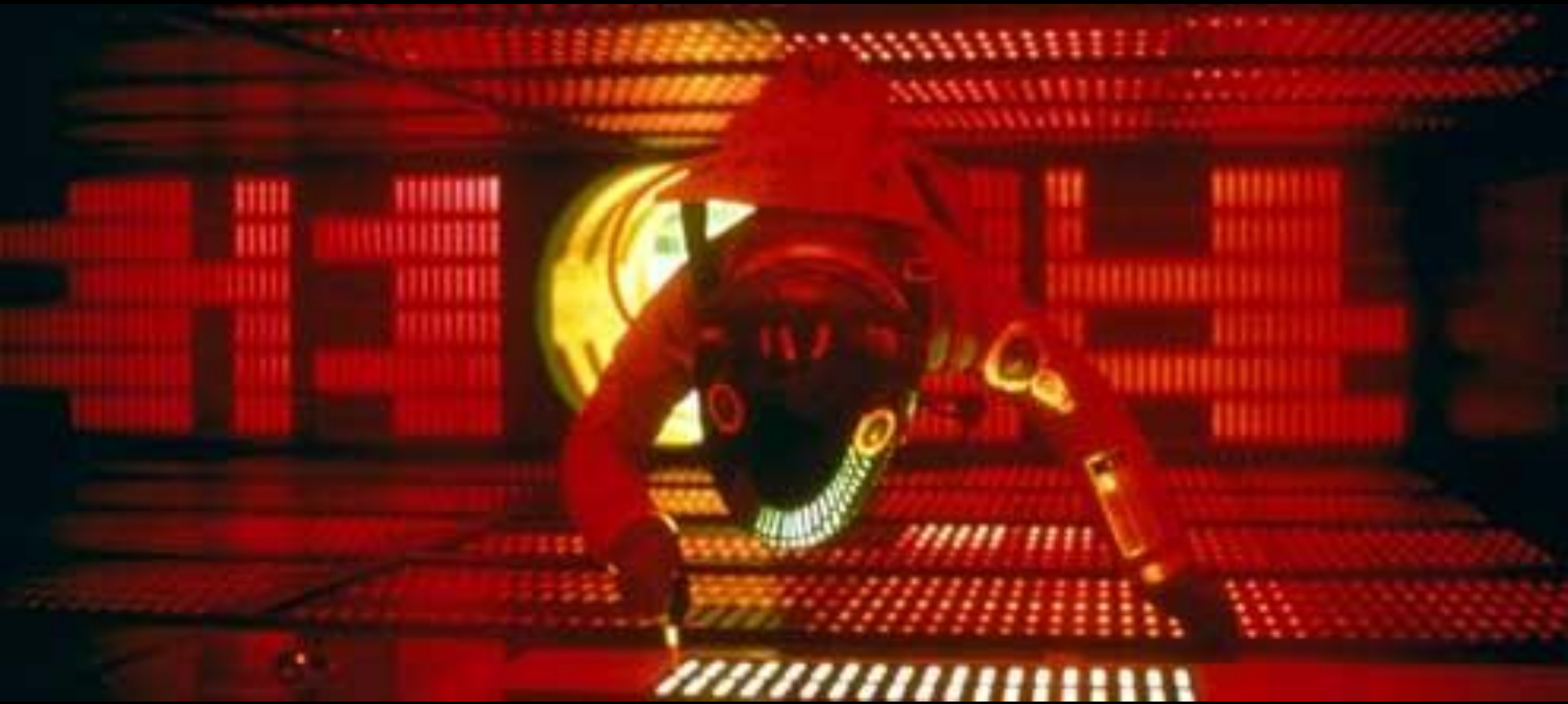
Kubrick, 2001 Odyssée de l'espace, 1968 L'astronaute « dévitalise » Hal, l'ordinateur de bord.